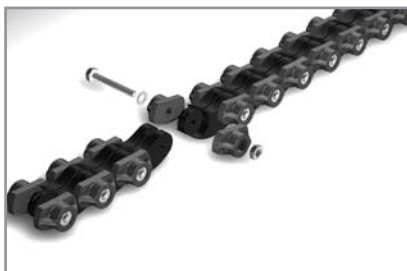
Zusammenfügen von Teil-Gliederketten