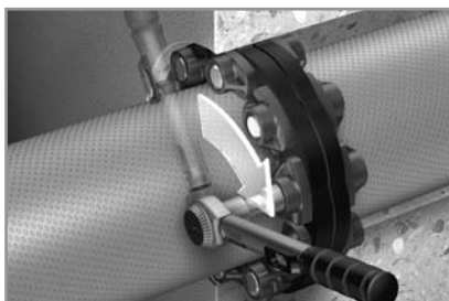
Anziehen der Schrauben

Die Anzahl und die Größe der Dichtmodule, die Sie zur Abdichtung der Medienrohre benötigen, entnehmen Sie bitte dem Berechnungsprogramm oder Tabellen. Gegebenenfalls wenden Sie sich bitte an Ihren Fachhändler.