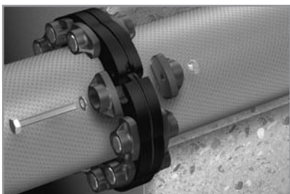
Zusammenfügen der freien Enden der Gliederkette