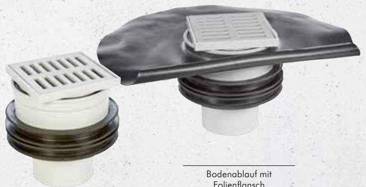
Bodenablauf mit Folienflansch