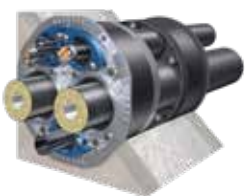
Variante: Quadro-Sicura® Nova 2-FW / breit für Doppel-/Elementwände