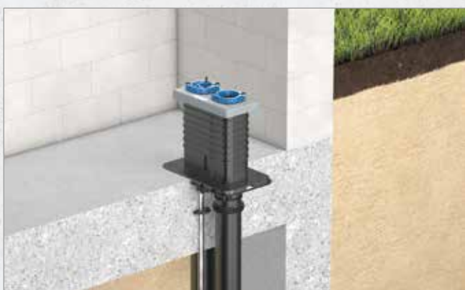
Systematische Darstellung: Einbau Quadro-Sicura® Nova R2

NOCH ZU ERSTELLEND E BODENPLATTE AUS WU-BETON (NEUBAU)