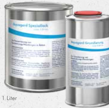
Liefergröße 1 Liter