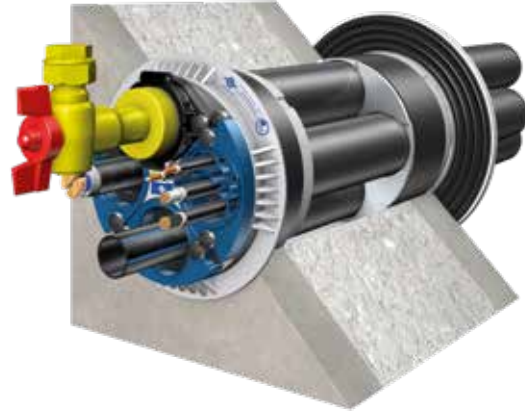
Quadro-Secura® Nova 1/breit mit breiter Außenabdichtung