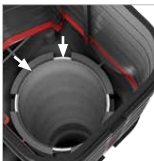
Sichtkontrolle: Oberkante Hülsrohr rastet deutlich sichtbar in Halterung ein (Pfeile)