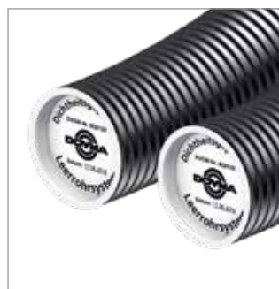
Werkseitig druckgeprüfte Mantelrohre – jetzt DN/OD 90 (ID 78)