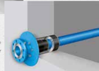
Quadro-Sicura® ADS Wasser