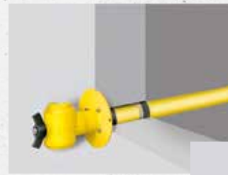
Quadro-Sicura® ADS Gas