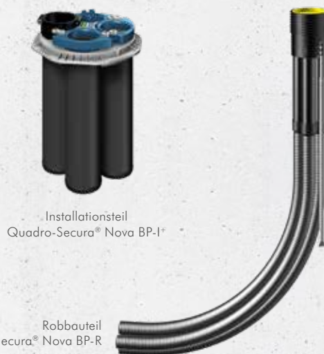
Installationsteil Quadro-Sicura® Nova BP-I*