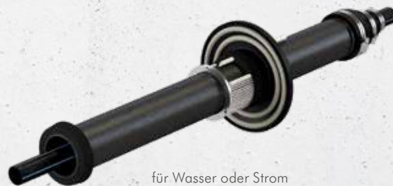
für Wasser oder Strom