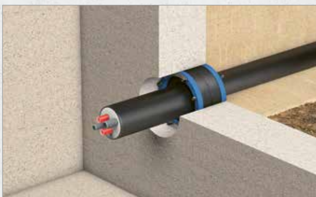
Systematische Darstellung: Einbau Curaflex Nova® Uno/breit in Kernbohrung