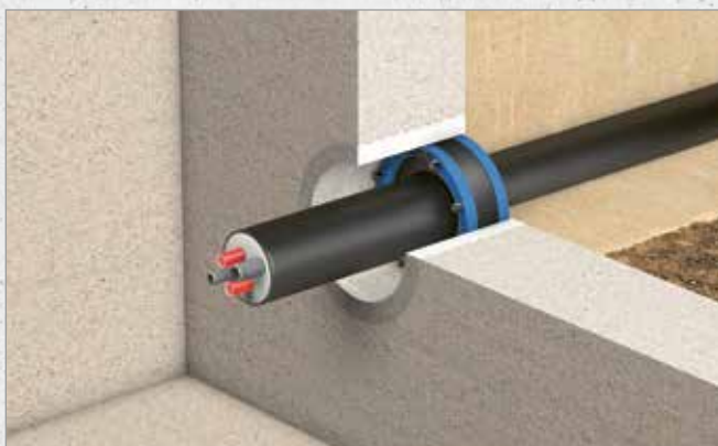
Systematische Darstellung: Einbau Curaflex Nova® Uno in Futterrohr Curaflex® 3000