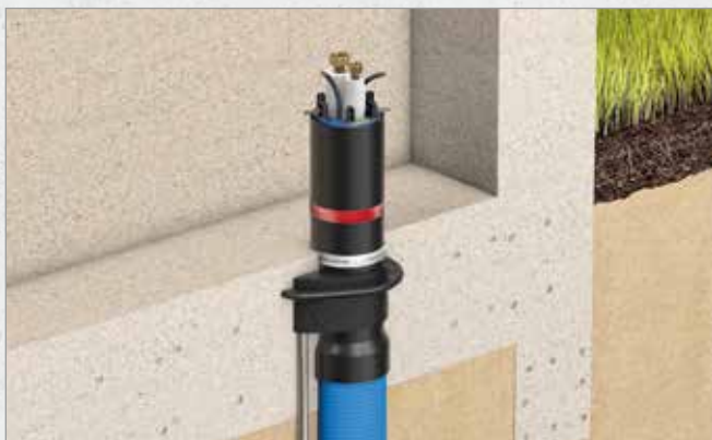
Systematische Darstellung: Einbau Quadro-Secura® ADS DN 100 in Kombination mit Curaflex Nova® Uno/M/Z

► EINSATZ: DRÜCKENDES WASSER /// IN NOCH ZU ERSTELLENDEN BODENPLATTE AUS WU-BETON