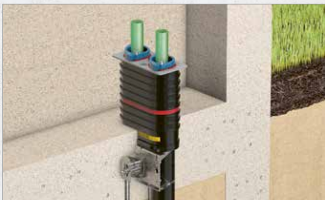
Systematische Darstellung: Einbau Quadro-Sicura® Basic R2

NOCH ZU ERSTELLEND E BODENPLATTE AUS WU-BETON (NEUBAU)