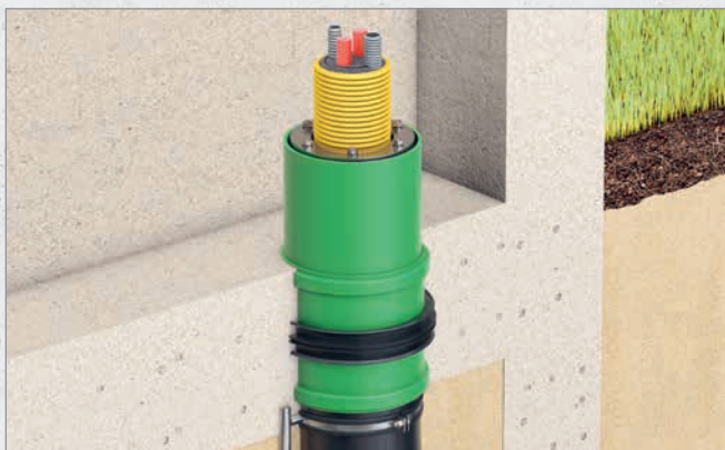
Systematische Darstellung: Einbau Dichtungseinsatz Curaflex® C40/SRB in Kombination mit Quadro-Sicura® E-BP/SRB

► EINSATZ: DRÜCKENDES WASSER /// IN NOCH ZU ERSTELLENDEN BODENPLATTEN AUS WU-BETON