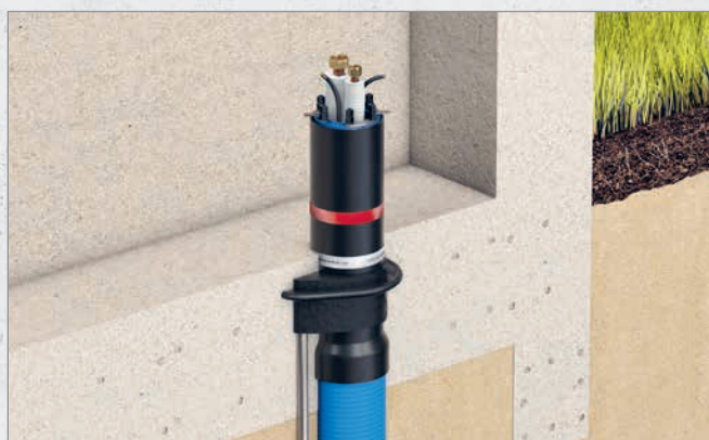
Systematische Darstellung: Einbau Quadro-Secura® ADS DN 100 in Kombination mit Curaflex Nova® Uno/M/Z

► EINSATZ: DRÜCKENDES WASSER /// IN NOCH ZU ERSTELLENDEN BODENPLATTE AUS WU-BETON