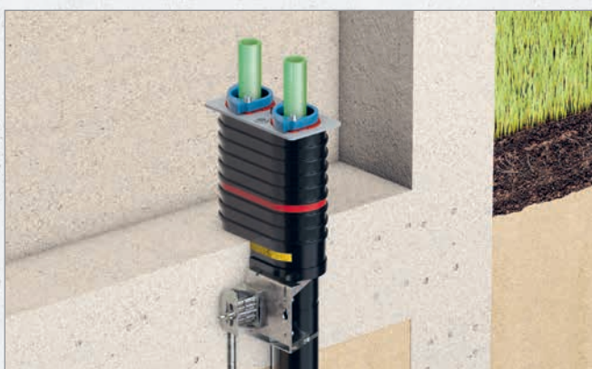
Systematische Darstellung: Einbau Quadro-Sicura® Basic R2

NOCH ZU ERSTELLENDEN BODENPLATTE AUS WU-BETON (NEUBAU)