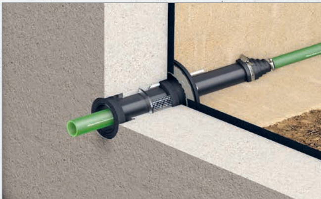
Systematische Darstellung: Einbau Quadro-Sicura® Quick/X für Wasser oder Strom

MAUERWERK ODER BETON (KEIN WU-BETON) MIT ABDICHTUNG NACH DIN 18533-3 BEI W2.1-E (SCHWARZE WANNE)