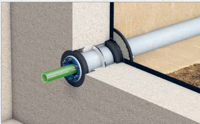
Systematische Darstellung: Einbau Quadro-Sicura® Quick/H in Kombination mit Dichtungseinsatz Curaflex Nova® Multi