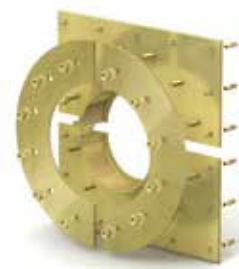
Variante: Curaflex® Futterrohr 7005/T – Geteilte Ausführung, zur Installation bei vorhandener Rohrleitung.