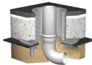
Variante: Curaflex® 4005/U als Sohlendurchführung

Spezialfaserzement mit fest verbundenem Fest- und Losflansch aus Gusseisen.