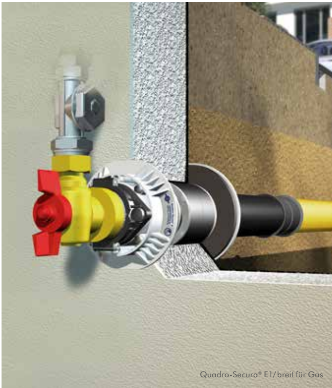
Quadro-Secura® E1/breit für Gas