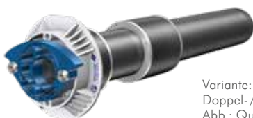
Variante: Quadro-Sicura® E2/breit für Doppel-/Elementwände (180 – 550 mm) Abb.: Quadro-Sicura® E2/breit für X-LWL