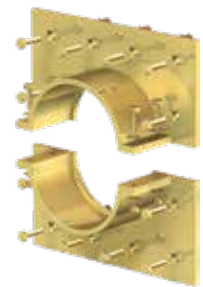
Variante: Curaflex® 8000/T – Geteiltes Futterrohr. Zur Installation bei vorhandener Rohrleitung.