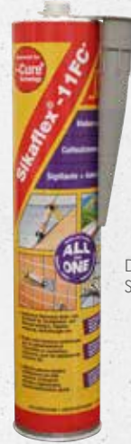
Dichtungsmasse Sikaflex-11FC (1756)