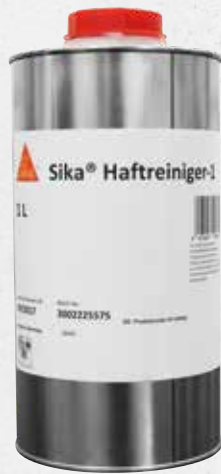
Sika Haftreiniger-1 (1754)