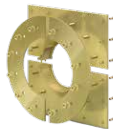
Variante: Curaflex® Futterrohr 7006/T – Geteilte Ausführung, zur Installation bei vorhandener Rohrleitung.