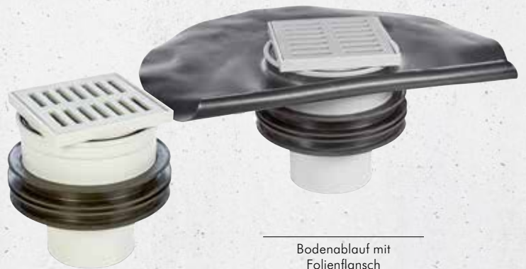
Bodenablauf mit Folienflansch