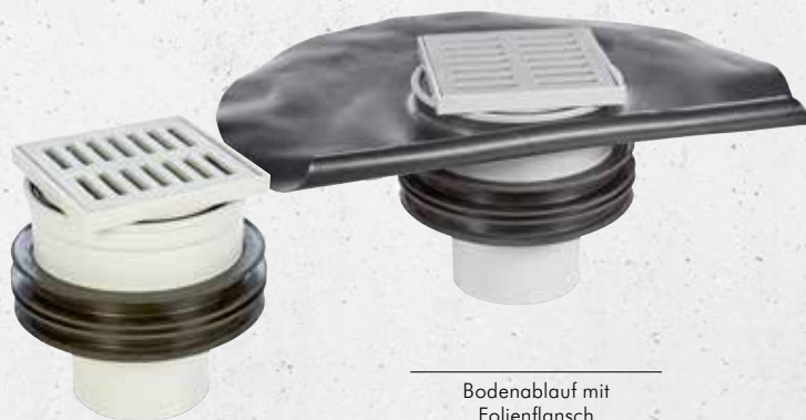
Bodenablauf mit Folienflansch