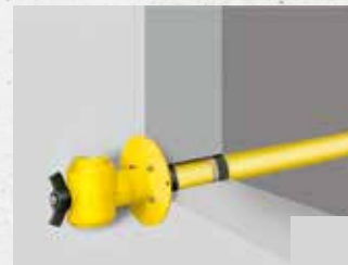
Quadro-Sicura® ADS Gas