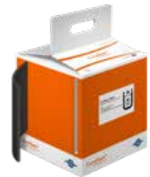
Curaflam® Rollit Box

Lieferumfang: 10 m Wickelband, 200 mm breit; incl. 30 Klebestreifen und 15 Brandschutzschildern, Einbauanleitung.