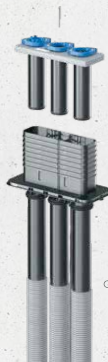
Quadro-Secura® Nova R3