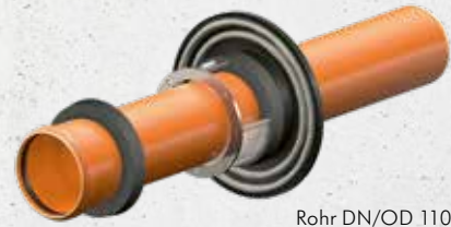
Rohr DN/OD 110