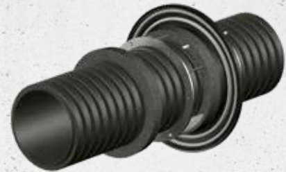
Rohr DN/OD 200