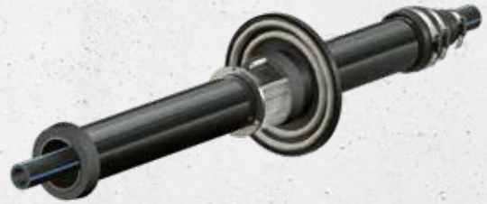
für Wasser oder Strom