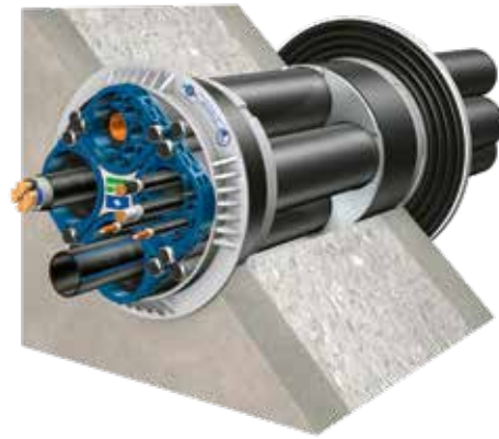
Quadro-Secura® Nova 1/breit mit breiter Außenabdichtung