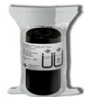
CurafLAM® Rollit ISO Pro Pack

Lieferumfang: 2,5 m Wickelband, 125 mm breit; incl. 4 Brandschutzschilder, Befestigungsdraht, Einbauanleitung.