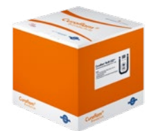
CurafLAM® Rollit ISO Pro Box

Lieferumfang: 10 m Wickelband, 125 mm breit; incl. 10 Brandschutzschilder, Befestigungsdraht, Einbauanleitung.