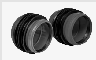
HKD KG- / KG2000-Doppelmuffe