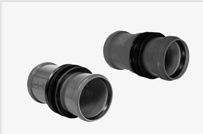
HKD KG-Wandelement / HKD KG2000-Wandelement