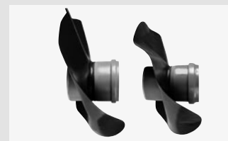
HKD KG- / KG2000-Einsteckflansch