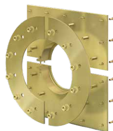
Variante: Curaflex® Futterrohr 7006/T – Geteilte Ausführung, zur Installation bei vorhandener Rohrleitung.