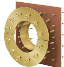
Variante: Curaflex® Futterrohr 7006 besandet